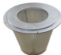
Filtration conique antistatique M