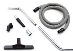
Kit accessoires intégré avec flexible antistatique