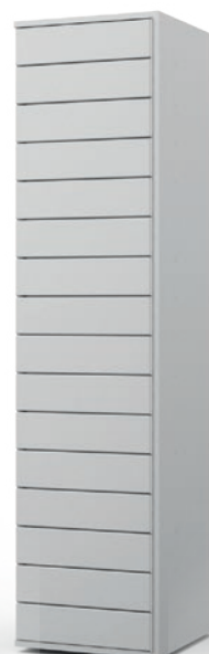
Colonne 16 casiers CL16