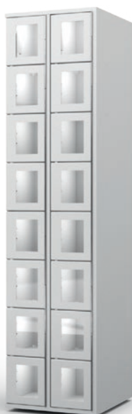
Colonne vitrée 8 casiers doubles CL16DW