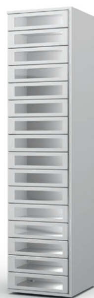
Colonne vitrée 16 casiers CL16W