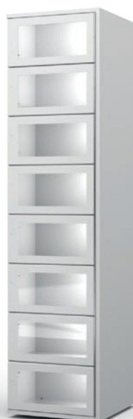
Colonne vitrée 8 casiers CL8W