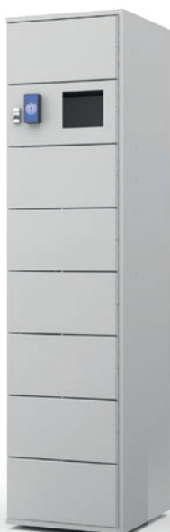
Colonne 8 casiers CL8