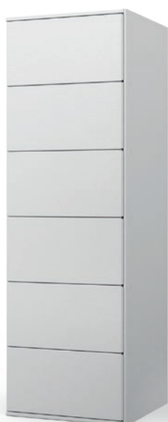
Colonne 6 casiers CL6XL

Les colonnes peuvent être utilisées seules ou associées à une machine à tambour