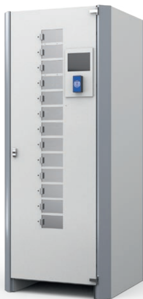
Machine tambour slim EPB 390 / EPB 700

Les colonnes peuvent être utilisées seules ou associées à une machine à tambour