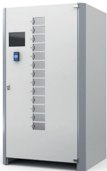
DA tambour large EP468 / EP800