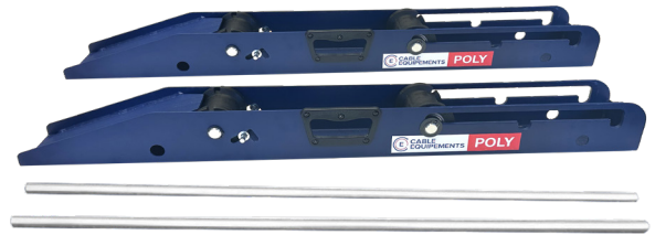
Démontable en 4 éléments

☑ Démontable, poignée de transport : facile à transporter