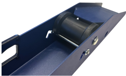
Système de blocage

☑ Blocage rapide des galets avant : pour faciliter le chargement et le déchargement du touret