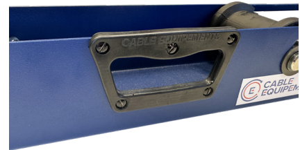
Poignée de transport